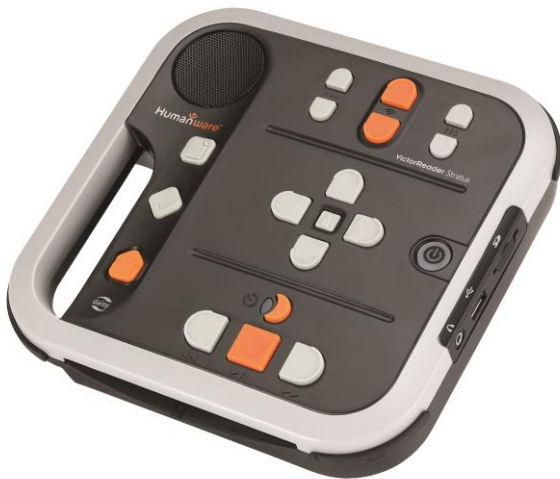
Victor Stratus 4 utan överlägg

Vid leverans sitter ett överlägg av plast på vissa spelarmodeller. Det täcker en del tangenter. Spelaren kan användas med överlägget på men får då lite begränsade funktioner.