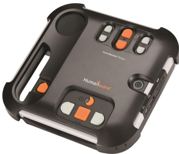
Victor Stratus 4 med överlägg monterat

Vid leverans följer, förutom själva spelaren och denna instruktion, följande med: